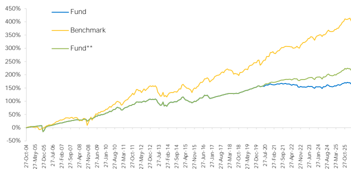
Kinerja Reksa Dana Sejak Diluncurkan

*OB: Obligasi, PU: Pasar Uang, SH: Saham